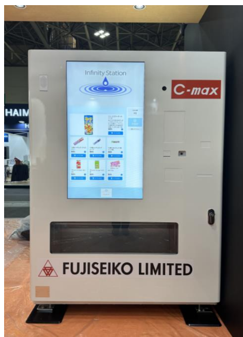
ツール管理システム『MV-31シリーズ』