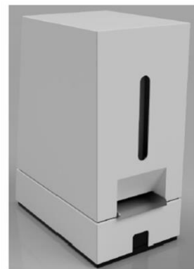
CL-76D / CL-76R