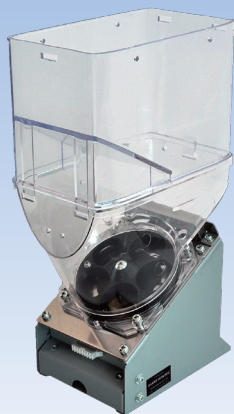
増量ユニット装着時

払出硬貨: 500/ 100/ 50/ 10/ 5/ 1円, 払出メダル: 外径25mm